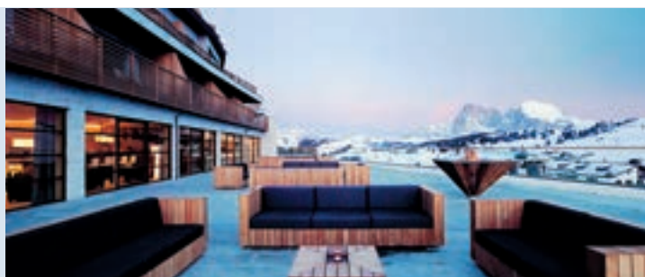
Das moderne Design soll jüngere, lifestyleorientierte Zielgruppen auf die Seiser Alm locken

Durch den Verbau von naturbelassenem Quarzitstein und der Holzummantelung in der Fassade, die die natürliche Bewegung der Berglandschaft aufgreifen soll, ergibt sich ein harmonisches Äußeres. Das größte Faustpfand des Hotels ist der Berg-Panoramablick, der durch geschickte Planung so in den Gesamteindruck integriert wurde, dass der Gast sowohl vom Zimmer als auch von den öffentlichen Bereichen sowie von Schwimmbad und Saunabereich aus die Landschaft genießen kann.