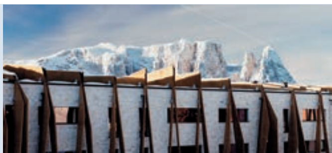
Die Holzummantelung der Fassade greift die natürliche Bewegung der Berglandschaft auf

Ein Höhepunkt des Hotel-Spa-Bereichs ist der großzügige Indoorpool, der längsseitig nur durch großflächige Fensterfronten begrenzt ist und über eine direkte Verbindung zum Panoramafreibad verfügt. Von hier aus schweift der Blick wie von selbst zur Seiser Alm, der Langkofelgruppe und dem Schlern. Die mit Holzliegen und einem großflächigen Steinboden ausgestatteten Liegebereiche erstrecken sich auf zwei Ebenen. Bei der Planung des weitläufigen Saunabereichs mit Relaxzone wurde die innenarchitekto-