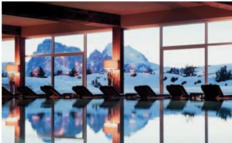
Die Glasfront des Schwimmbads gewährt freie Sicht auf das Bergpanorama