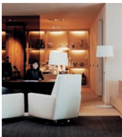
Spa-Managerin Gabi Bernardi im großzügigen Wellness-Empfangsbereich

gezielt in Richtung Gesundheitstourismus. Seit Sommer 2011 werden hierfür spezielle Vorsorgeuntersuchungen und individuell abgestimmte Therapien und Behandlungen im Haus angeboten. Dabei setzt man auf eine Verbindung von moderner Medizin und traditionellen Heilmethoden. Die Gesundheitsprogramme umfassen auch ein Konzept für gesunde Ernährung und ein facettenreiches Bewegungsprogramm.