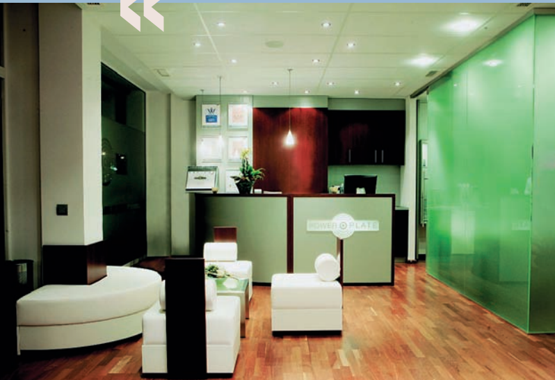
Julio Fischer von Power Plate Deutschland