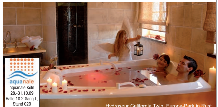
Hydroxur California Twin, Europa-Park in Rust